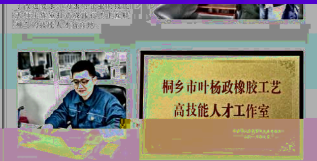
桐乡市叶杨政橡胶工艺高技能人才工作室